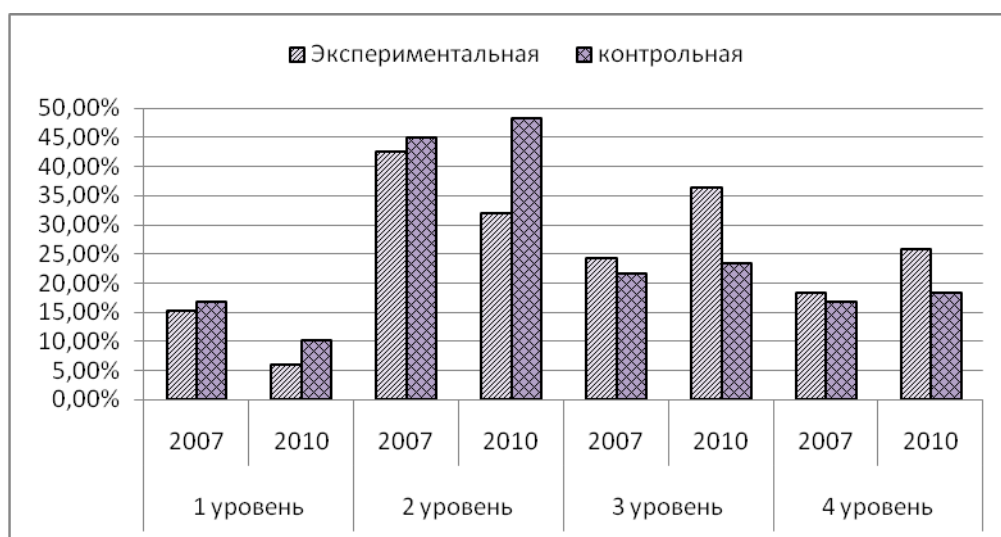
Рис. 3. Динамика уровней развития творчества воспитанников

Данные исследования подтверждают, что даже при минимальной степени развития творческих способностей и наличия творческого потенциала в условия воспитывающей среды учреждения дополнительного образования детей воспитанник продуцирует позитивную динамику творческой деятельности, появляется устойчивая тенденция к самоактуализации и к творческому самовыражению.