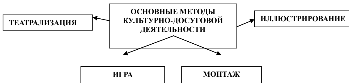
Рисунок 2. Методы реализации культурно-досуговых программ.

1. Метод иллюстрирования заключается в представлении содержания через трансляцию какого-либо материала, он использует эмоционально-выразительные средства для визуализации.