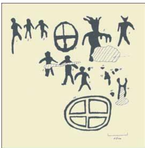
Рис. 1. Писаница Синская. Графическая копия 17 рисунков 1-ой плоскости.

В Концепции Проекта определены перспективы развития изобразительного искусства в единстве целей, задач и путей их достижения. Практическая реализация Концепции, по мнению разработчиков, должна опираться на исторически сложившуюся в России и Республике Саха («Якутия») систему художественного образования. Основная идея проекта «Рисуем все» – культура и искусство – важнейшие компоненты всестороннего образования, которое обеспечивает развитие личности.