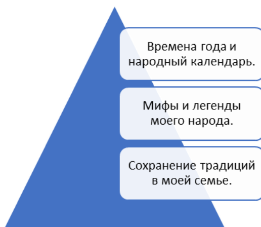
Рис.1. Тематика образовательной платформы «Культурное пространство».

Мероприятия программы «Художественная культура нашей страны» направлены на привлечение к совместному творчеству каждой семьи, поведение совместных проектов с центрами художественных промыслов, фольклорными коллективами, творческими мастерскими. Приобщение учащихся к народной культуре способствует повышению уровня социального развития нравственного взросления обучающихся, приобщения их к изучению мирового художественного наследия, приобретению опыта творческого развития, исследования наследия многонациональной культуры нашей страны.