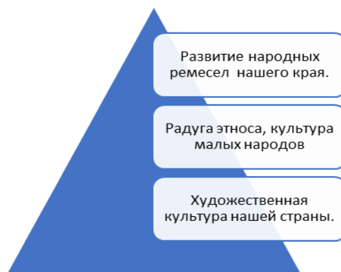
Рис.2. Тематика образовательной платформы « Многонациональная культура нашей страны»

Мероприятия программы «Арт-события и их закономерность в мировом культурном наследии» направлены максимально культурно-исторический охват событий культурной жизни разных народов. В ходе работы по созданию воспитывающей культурной среды в организациях необходимо создать базу учета по участию каждого обучающегося в фестивалях и конкурсных мероприятиях по направлениям «Научные исследования юных», «Искусство и творчество», «Спорт и здоровый образ жизни» с функцией «обратная связь». Необходима конкретная фиксация прохождения конкурсных образовательных маршрутов каждого обучающегося, с целью вовлечения всех обучающихся с учётом периодов возрастного развития. Необходимо предоставить разнообразие всех возможных вариантов для коллективного и индивидуального физического, творческого участия детей. Увеличение возможности различных видов и способов участия детей с ОВЗ возможности их дистанционного и очного участия в подготовке и проведении художественного события. На рисунке 3 представлена тематика третьей ступени образовательной платформы воспитывающей культурной среды, знакомящая с арт-событиями мирового культурного наследия.