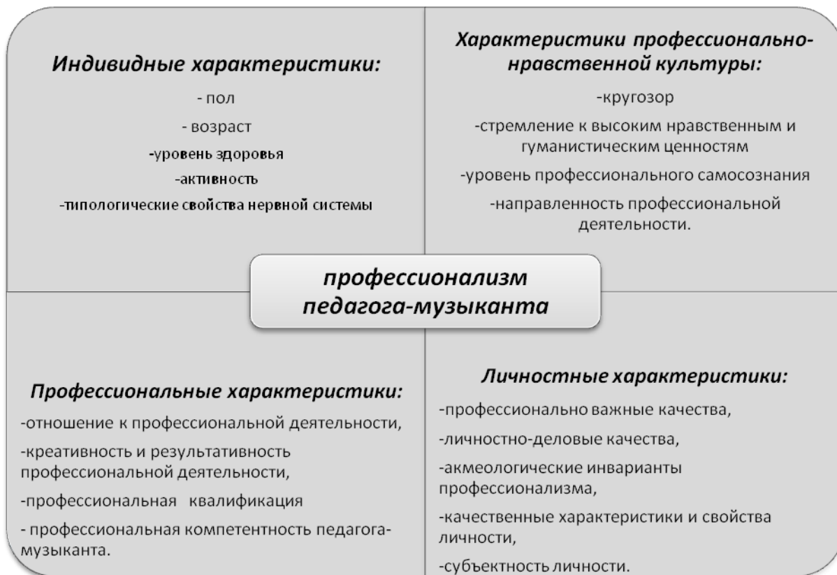
Таблица 1. Структура профессионализма педагога-музыканта

Исходя из представленной выше структуры, а также основываясь на акмеологическом подходе к изучению профессионализма, мы предлагаем собственное определение профессионализма педагога-музыканта. Итак, профессионализм педагога-музыканта – это сложная и многоуровневая структура, сочетающая высокоразвитые индивидуальные, личностные, профессиональные и культурно-нравственные характеристики, позволяющие творчески и на высоком уровне осуществлять профессиональную музыкально-педагогическую деятельность. Точное определение понятия «профессионализм» в сфере музыкальной педагогики позволит каждому музыканту и его педагогу верно выстраивать стратегию достижения вершин в своей профессии.