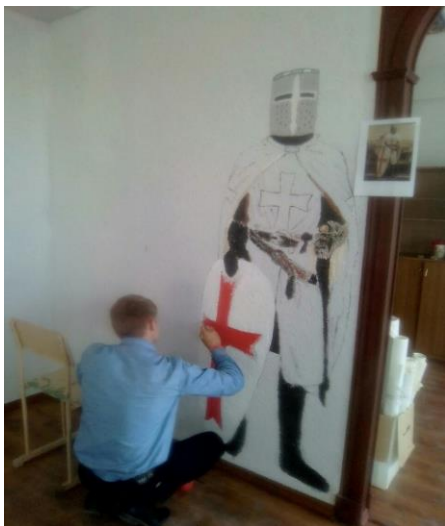
Рисунок 2 - Проектная работа Картины тевтонских рыцарей на стене музея Неманского СУВУ

В течение учебного года воспитанники выполняют творческие проекты, где самостоятельно выбирают тему, материал, технику исполнения; показывают уровень полученных знаний, умений и навыков.