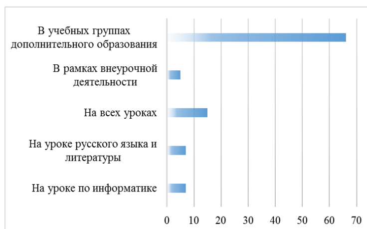
Рис. 2. Ответы обучающихся 10-11 классов о том, в какой из образовательных форм желательно формирование информационной компетентности

Второй вопрос был ориентирован на то, в каком формате и где в образовательном пространстве общеобразовательной организации возможно осуществлять формирование информационной компетентности. Ответы расположились следующим образом.