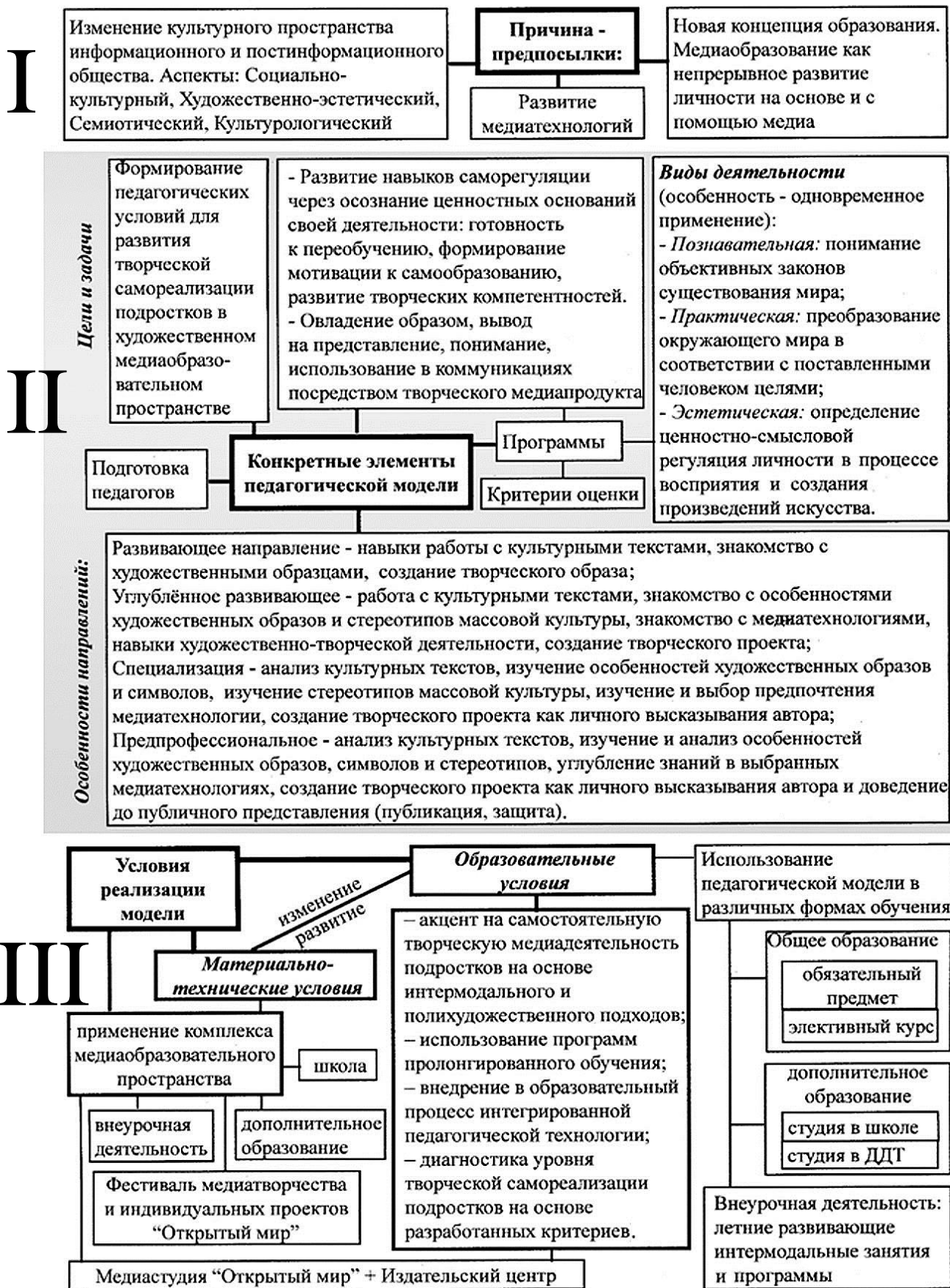
Рис. 1. Педагогическая модель развития творческой самореализации подростков в художественном медиаобразовательном пространстве