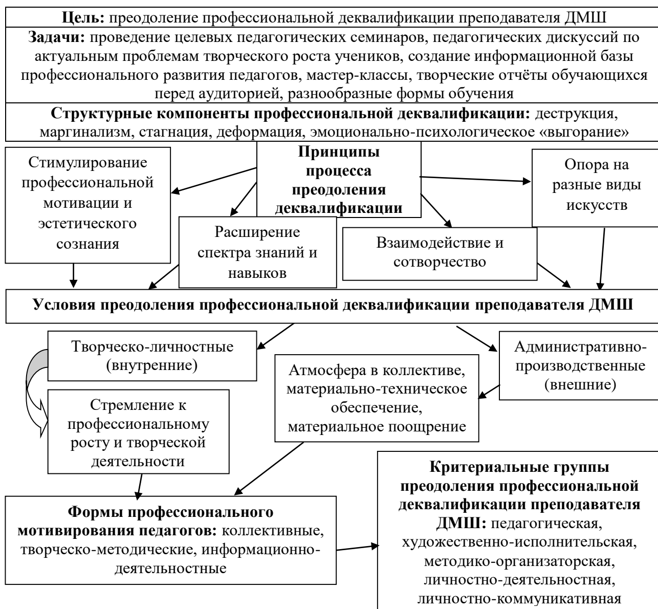
Рис.1. Практико-ориентированная модель процесса преодоления профессиональной деqualификации преподавателя ДМШ

использования на практике. Указывается важность организации творческих отчётов обучающихся перед аудиторией.