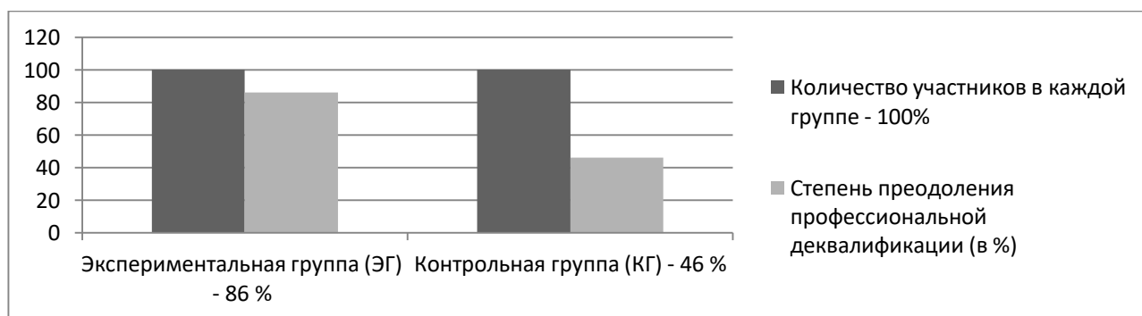
Рис. 3. Общие показатели преодоления профессиональной деквалификации в экспериментальной и контрольной группах (контрольный эксперимент)

В завершение контрольного эксперимента были измерены общие показатели преодоления профессиональной деквалификации преподавателя ДМШ (рис. 3):