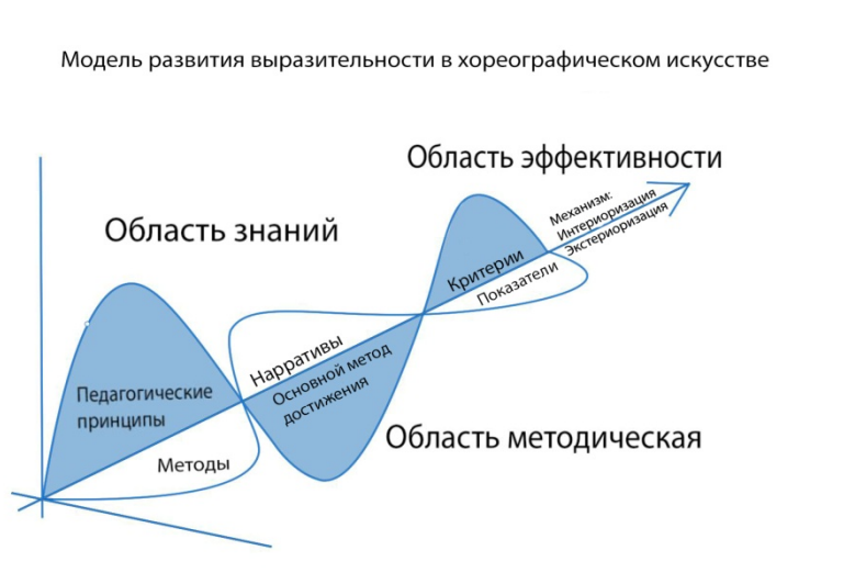
Рисунок 2. Модель развития выразительности в хореографическом искусстве

Решение задачи проектирования и проведения локальных экспериментов позволило эмпирическим путём определить соответствующие возрасту обучающихся эффективные методы и дидактические приемы развития выразительности в хореографическом искусстве в системе дополнительного образования. В результате длительного наблюдения за детьми, был сделан вывод: показ каждого движения при разучивании классического танца педагогу необходимо сопровождать объяснением: что, зачем, почему исполняется так, а не иначе (часть составляющей области знаний в модели). Таким образом, процесс развития выразительности обеспечивается повествованием или нарративными приёмами обучения, ставшими основой авторского метода «Программная хореография», который способствует также общему интеллектуальному и эмоциональному развитию ребенка (составляющая методической области в модели).