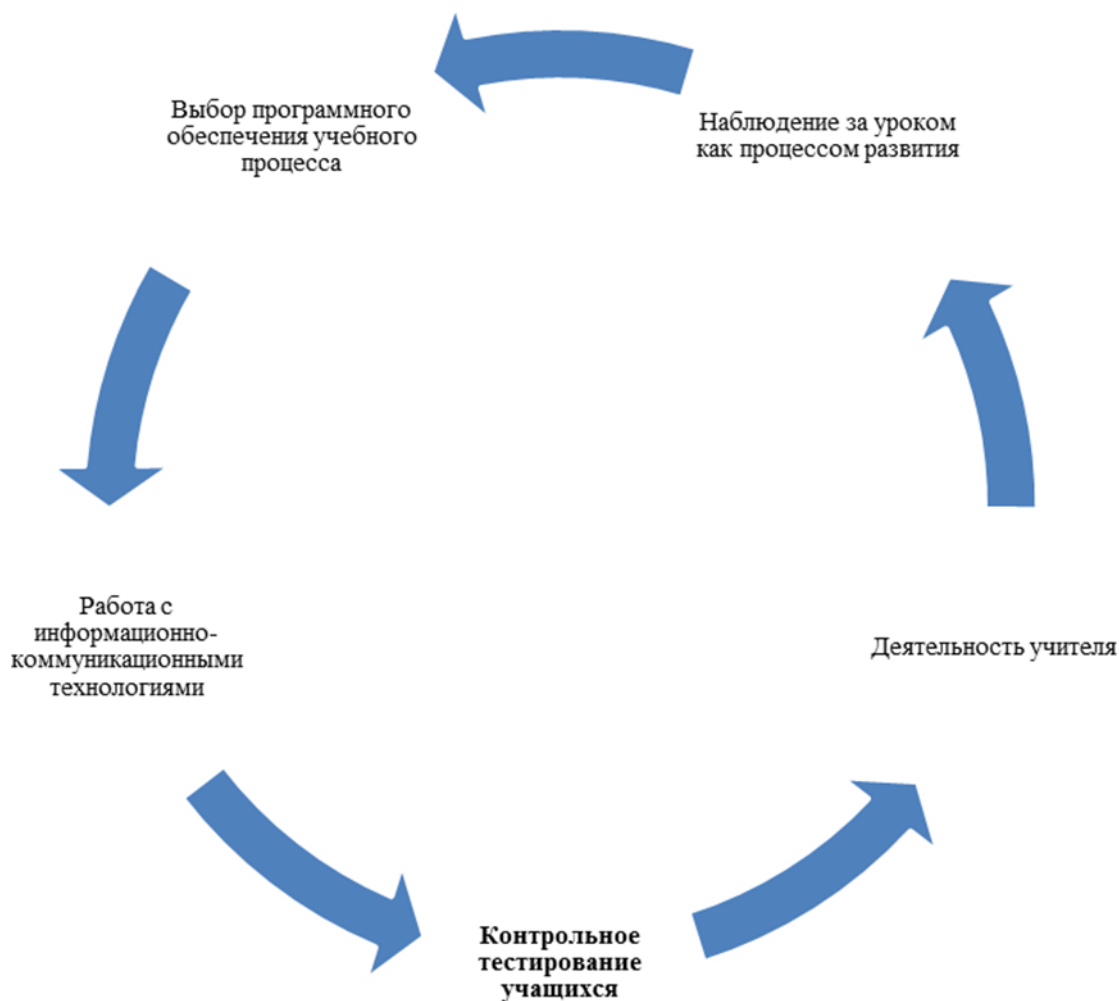
Рисунок 3. Процесс диагностики качества культурологического образования в современной школе.

эффективность модели повышения уровня культурологического образования школьников в условиях реализации культурно-познавательных программ; актуальность современных подходов к оценке качества художественного и культурологического образования в общеобразовательных организациях ( классический, реальный, альтернативный, перспективный ). Процесс диагностики качества культурологического образования в современной школе предствален на рисунке 3.